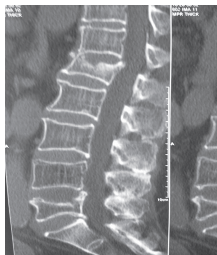
Рисунок 1 – Компрессионный перелом L1 и L5 позвонков на фоне остеопороза

Диагностический комплекс включал общеклиническое, анамнестическое, неврологическое обследования, обзорную рентгенографию поврежденного отдела позвоночника, а также КТ, МРТ и МСКТ по необходимости. Рентгеновское исследование проводилось для определения уровня, типа и степени перелома (рис. 1).